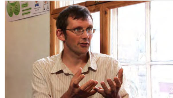
Rob Hopkins (GB): mouvement des villes en transition