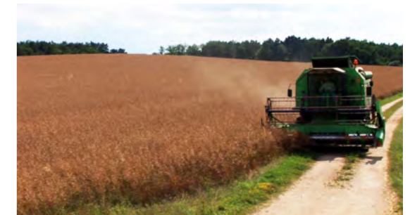
Zerealienwirt Forey, Burgund

Ständiges Wachstum ist keine Lösung. Wir werden zu Millioneninvestitionen in Riesenmaschinen gezwungen, obwohl wir auf dem Land viel zahlreicher sein könnten!