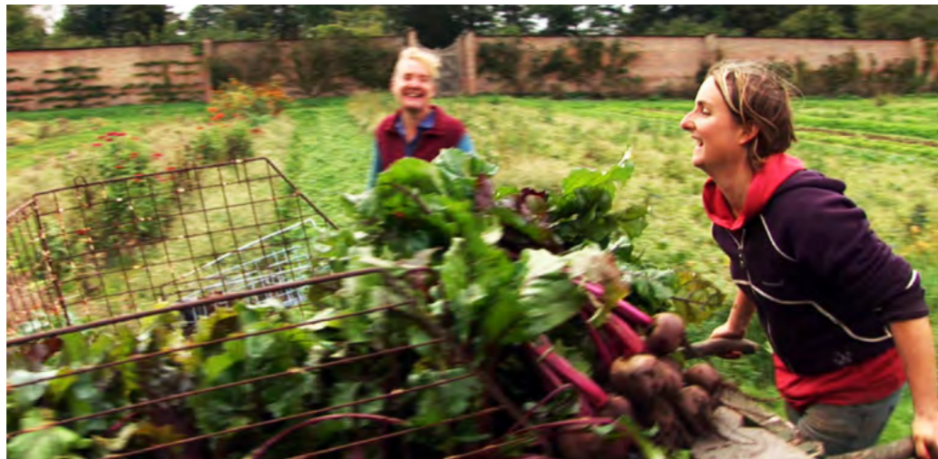
Erzeuger-Verbraucher Gemeinschaft „Leigh Court Farm“ bei Bristol

wandt: Die konkreten Handlungsvorschläge aus dem Film Voices of Transition tragen dazu bei, dass Nachbarschaften resilienter, d.h. widerstandsfähiger gegen Krisen werden. Unser Nahrungsmittelproduktionssystem zu lokalisieren, ist dabei nur die erste Etappe des Wandels. Auch die