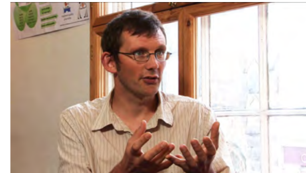
Rob Hopkins PhD (GB): Gründer Transition Bewegung