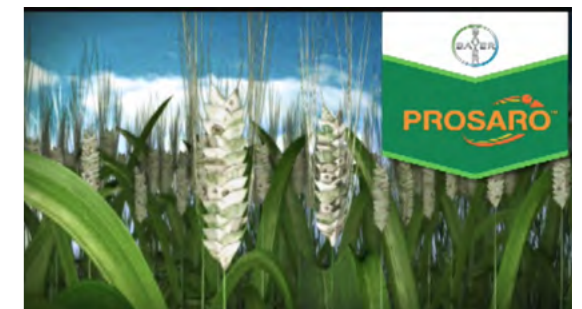
Werbung für Fungizid, Bayer-Konzern

Maximizing profits... Growing with Prosaro, it's like growing money!